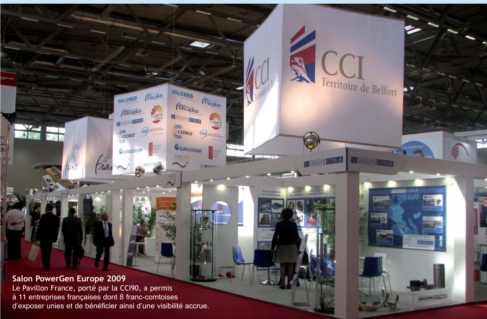
Salon PowerGen Europe 2009

Le Pavillon France, porté par la CCI90, a permis à 11 entreprises françaises dont 8 franc-comtoises d'exposer unies et de bénéficier ainsi d'une visibilité accrue.